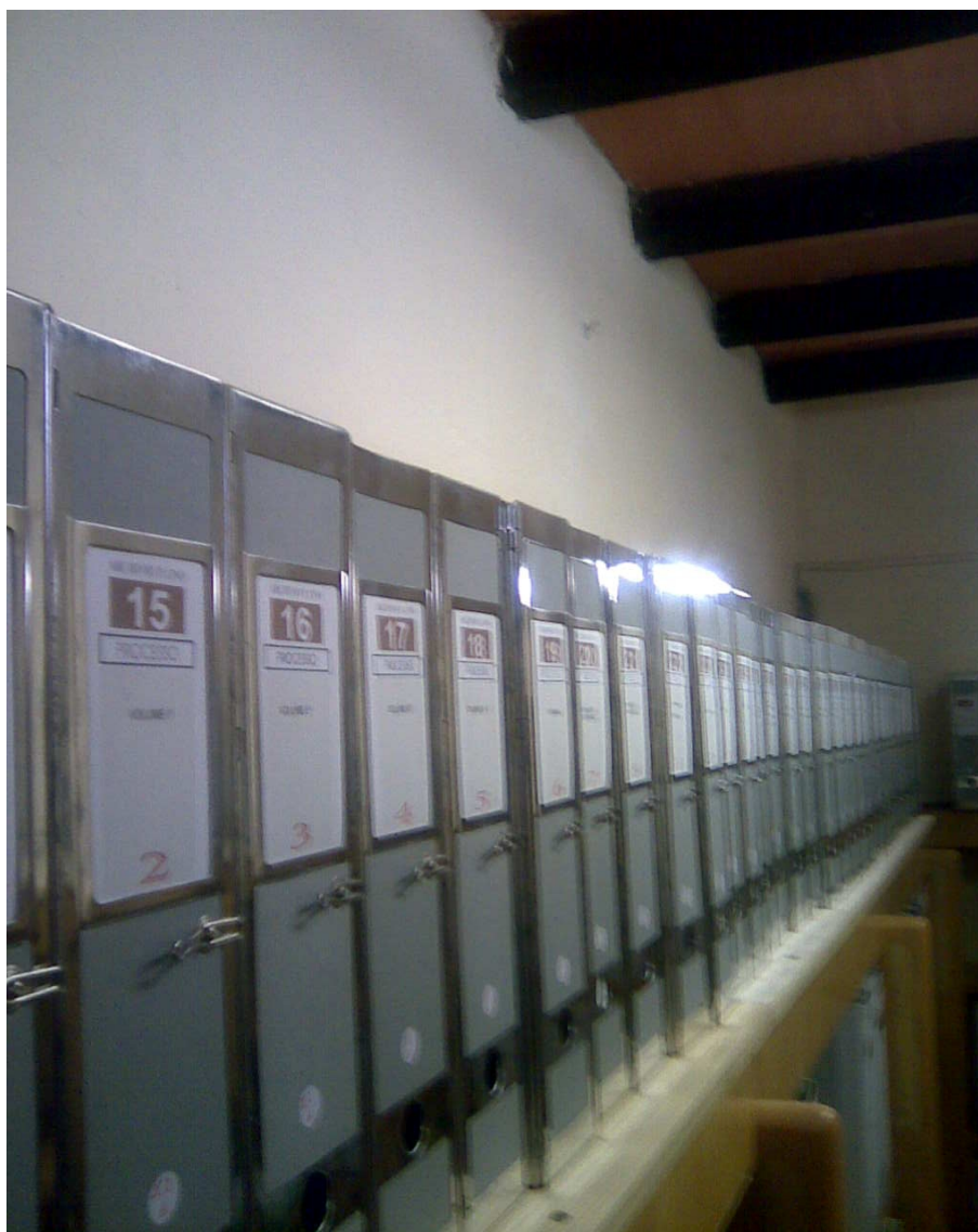
Il fondo archivistico Padre Lino collocato, dopo il lavoro di riordinamento, nell'ultima scaffalatura dell'Archivio conventuale della SS. Annunziata.