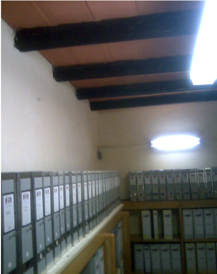
I locali di conservazione dell'archivio, presso il Convento della SS. Annunziata di Parma, dopo i recenti lavori di riordinamento.